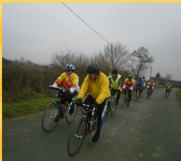
Un président se doit de montrer ...la route