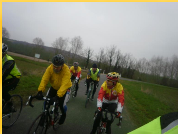
Le président et madame, touchant...mais ...