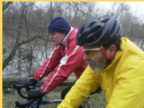
Version casque ou bonnet ?